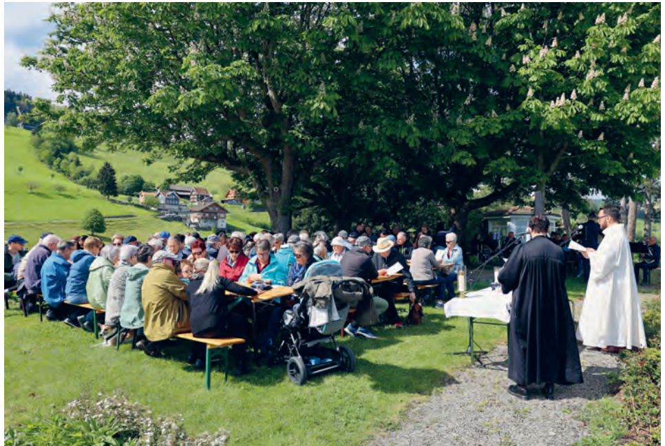
Vor traumhafter Kulisse durften wir an Auffahrt den Bildschachen-Gottesdienst feiern.