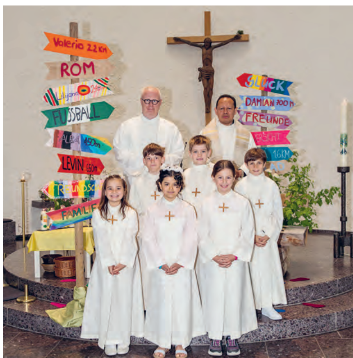
«Auf dem Weg mit Jesus» lautete das Thema der sechs Erstkommunionkinder in Buechen-Staad.