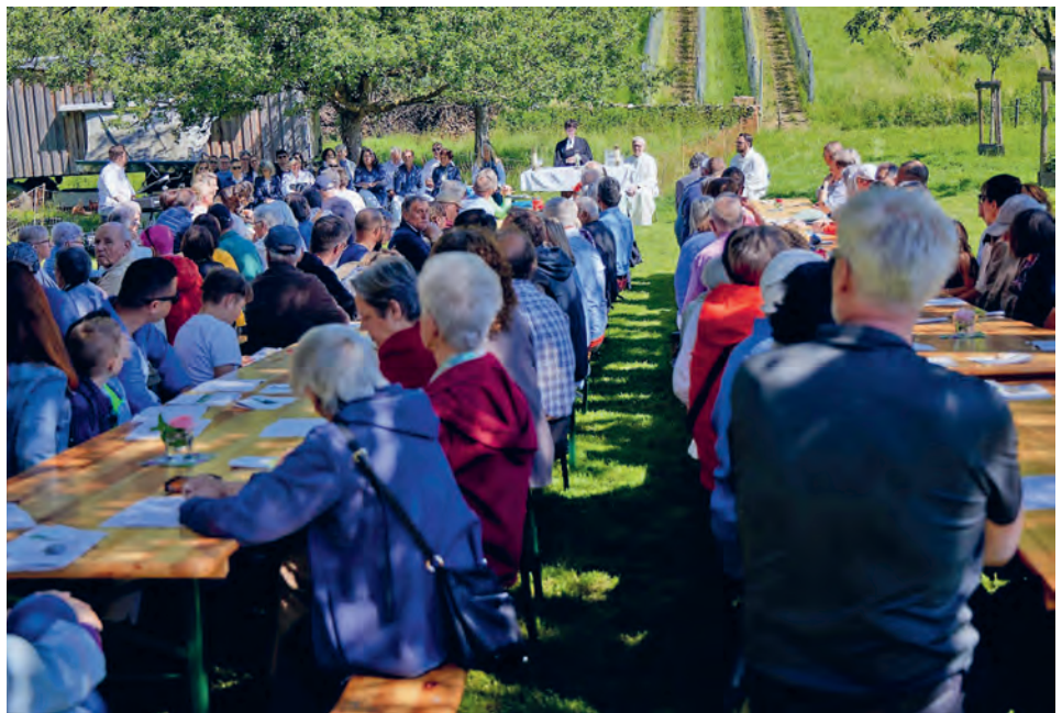
Der Gottesdienst für die Winzer- & Weinsegnung fand bei schönstem Wetter statt.