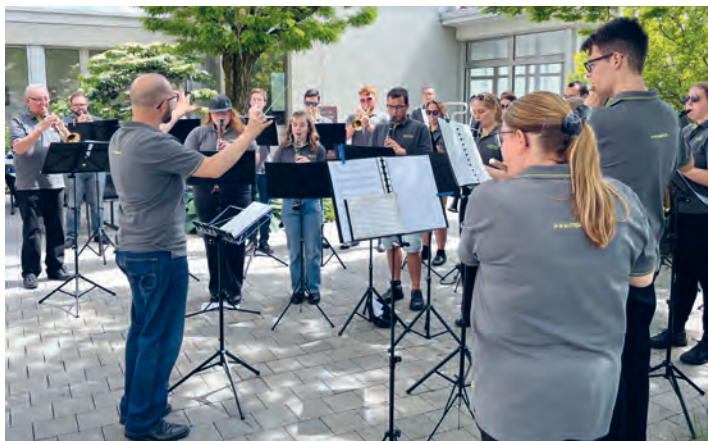
Muttertagsständchen im Trüeterhof

Bei der Migros Aktion «Support Culture» sind insgesamt 8699 Bons auf unser Vereinskonto gutgeschrieben worden! Das entspricht in diesem Jahr einer Summe von 1'817.60 Franken für unsere Vereinskasse. Herzlichen Dank für Ihre Unterstützung.