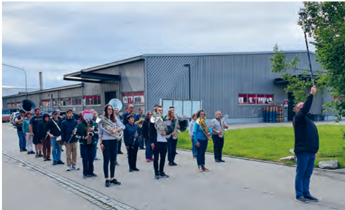
«Auch die Parademusik will geübt sein!»

Kommendes Wochenende, 14.-16. Juni, findet in Mels das Kantonale Musikfest statt, an dem sich über 3500 Musikantinnen und Musikanten in ihren Vereinen im friedlichen Wettstreit messen. Unser Tag ist der Sonntag, 16. Juni. Nach intensiver Vorbereitungszeit tragen wir das Aufgaben- und Selbstwahlstück um 10.45 Uhr im Wettspiellokal Schulhaus Feldacker der 3-köpfigen Jury vor. Am Nachmittag um 15.30 Uhr heisst es dann «Spiel vorwärts, Marsch» zum Vortrag auf der Parademusikstrecke, hoffentlich mit unserem Jubiläumsmarsch «Cutis Tale». Insgesamt 28 Vereine nehmen in unserer Stärkeklasse 3. Klasse Harmonie am Wettbewerb teil. Wir hoffen natürlich auf das nötige Wettkampfglück und sind gespannt, wie wir im Vergleich zu diesen stehen. Kommen sie doch mit nach Mels und geniessen sie einen Tag voller Musik! Wir freuen uns auf Ihre Unterstützung.